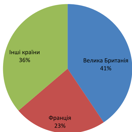
Рис. 2. Сукупна кількість проектів державно-приватного партнерства, що досягли фінансового закриття у 2016 р., за країнами ЄС

Активно розвивається ДПП у Російській Федерації. Станом на кінець 2016 р. в цій країні реалізується понад 1600 проектів ДПП, також в основному у вигляді концесійних угод, серед них 250 регіональних проектів ДПП з інвестиціями понад 200 млн руб. У Російській Федерації проекти ДПП впроваджуються в таких галузях: соціальна, комунальна, енергетична, ІТ та транспортна інфраструктура тощо. Тобто значну частку проектів становлять ті, які безпосередньо впливають на якість життя громадян, а отже, роблять свій внесок у досягнення Цілей сталого розвитку.