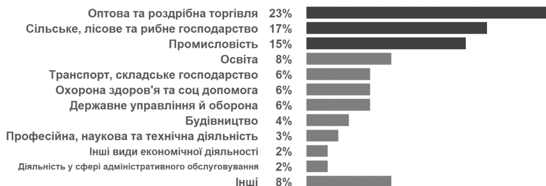
Рис. 3. Частка зайнятих за галузями економіки у 2021 р., %