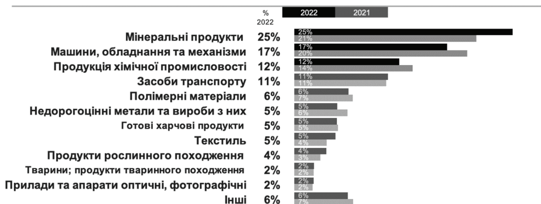
Рис. 2. Частка товарних груп від загального імпорту за 2021 та 2022 р., %

За прогнозами НБУ, за умови відсутності нових значних шоків, у 2023–2025 рр. триватиме відновлення ринку праці на тлі зростання економіки та доволі м'якої фіскальної політики. Рівень безробіття поступово знижуватиметься: у 2023 р. – до 18,3 %, у 2024 р. – до 16,5 %, а у 2025 р. – до 14,7 %. Однак він перевищуватиме довоєнний рівень, зокрема з огляду на ймовірне збереження значних кваліфікаційних